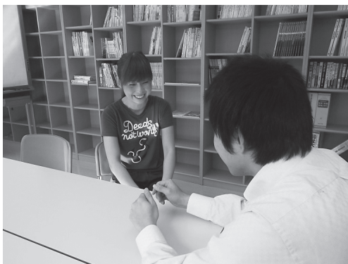
1対1の対話「トーキング」