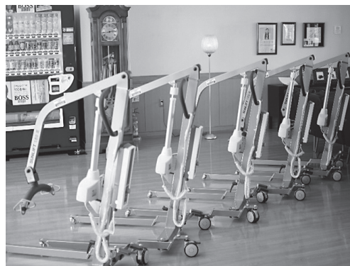
導入した移乗リフト