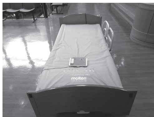
自動体位変換機能付きエアマット

こういう考え方を1対1で丁寧に伝えていった。その結果、現在では1日7.5時間労働、残業はほぼゼロを実現している。